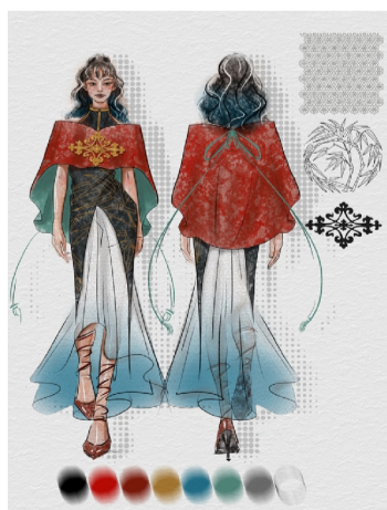
作品名称:竹韵 作者:周颖钰 指导老师:彭庆慧