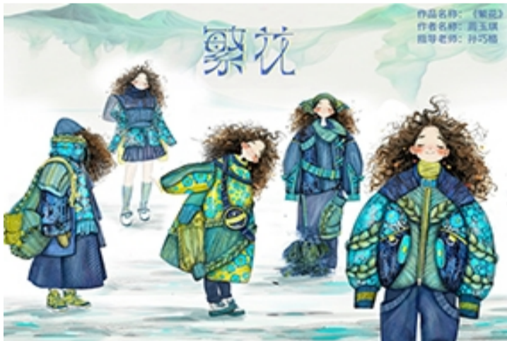
作品名称:繁花 作者:周玉琪 指导教师:孙巧格