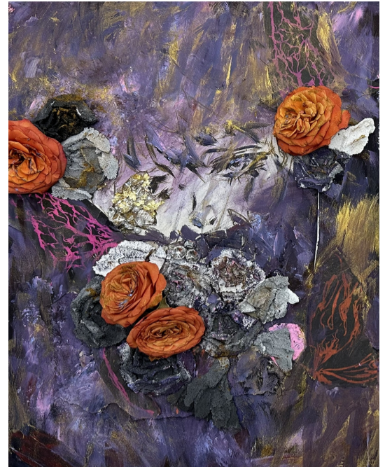
作品名称:LILYSSES 作者:黄泽莹 指导老师:文淑丽