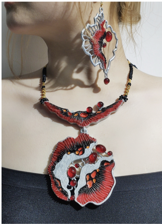
作品名称:自然 作者:邵宇洁 指导教师:马婷婷