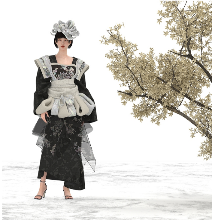
作品名称:《兰》 作者:马行宇 指导教师:邵文静