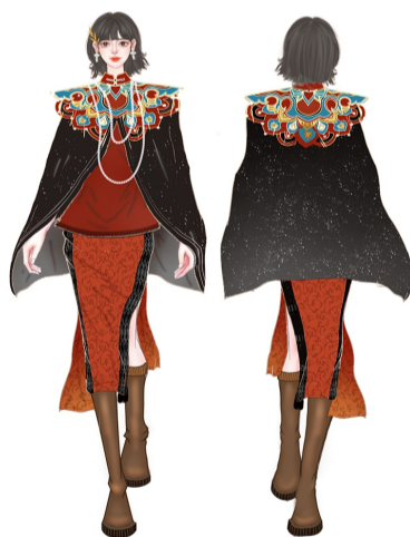
作品名称:海昏印象 作者:杨楚钰 指导老师:彭庆慧