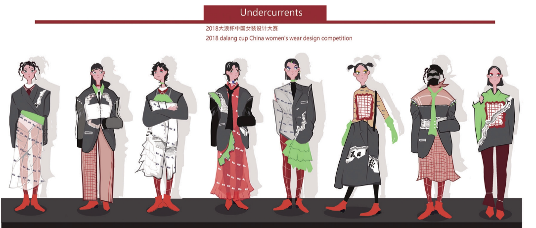
作品名称:嬉 作者:肖娴 指导老师:胡艳丽