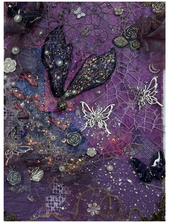
作品名称:利莫里亚的人鱼 作者:宋嘉钰 指导老师:文淑丽

本期“学生作品赏析”我们选登了服装设计学院服饰设计专业与产品设计专业的优秀学生作业。指导老师马婷婷,通过专业课程《3D 打印》,让学生感受数字化配件设计与应用的实践过程,指导老师邵文静在专业课程《3D 服装设计》中,通过虚拟仿真技术为学生提供更直观、真实的服装全流程学习体验,同时培养学生创新思维和动手实操能力,以适应未来服装行业的快速发展和变革;指导老师文淑丽在专业课程《创意思维与表现》中,通过创意设计思维,培养同学们的审美能力、艺术修养和创新能力;在指导老师胡艳丽负责的专业课程《男装设计》,指导老师彭庆慧负责的专业课程《女装设计》,指导老师孙巧格负责的专业课程《童装企划及产品设计下》中,使学生理解成衣设计、商品与市场之间的关系。强调培养学生的动手实践能力,在综合设计过程中的思维分析能力,以及在设定的服装主题风格中进行设计展开的把控能力,致力为服装企业输送优质人才。