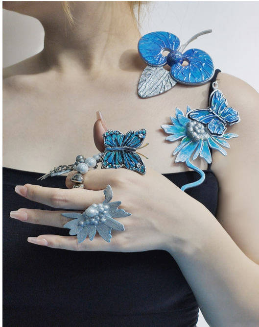
作品名称:nature 作者:孙佳瑶 指导教师:马婷婷