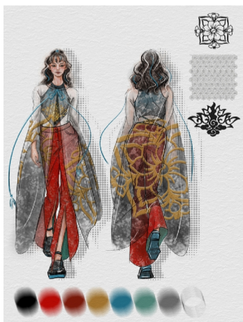
作品名称:汉风 作者:周颖钰 指导老师:彭庆慧